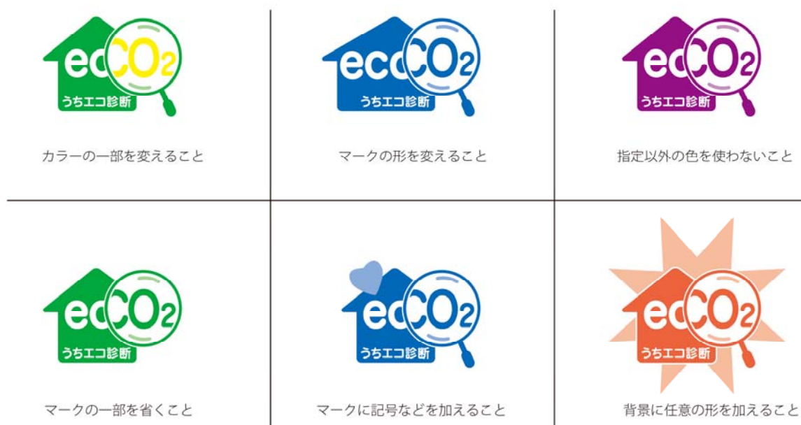
図 4 使用禁止の例