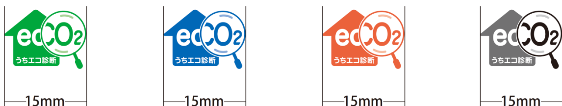
図 3 ロゴマークの大きさ